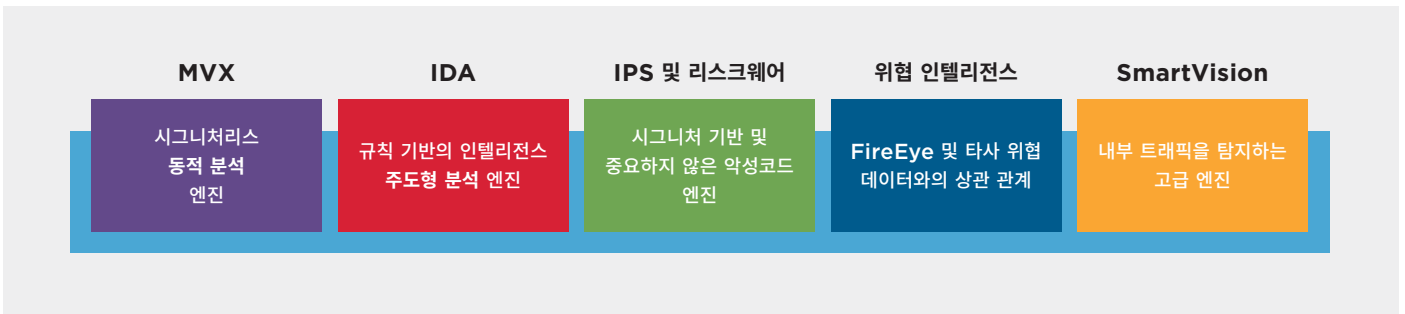
그림 4. FireEye Network Security의 모듈식 컴포넌트.