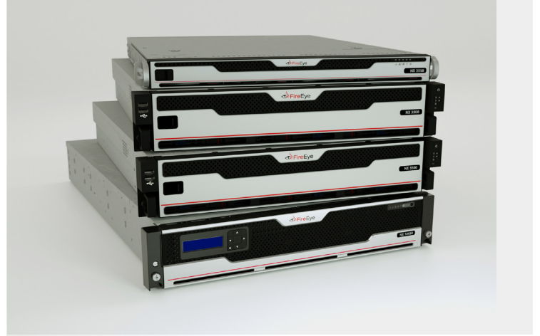
그림 2. NX 2550, NX 3500, NX 5500, NX 10450을 포함한 통합 네트워크 보안의 예